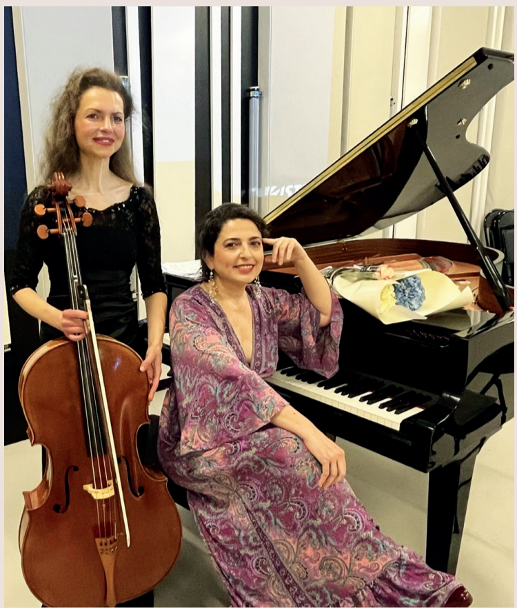
Триумф азербайджанской музыки в штаб-квартире UNESCO

В штаб-квартире UNESCO в Париже в рамках конференции, посвященной 35-й годовщине программы «Шелковый путь: разнообразие, диалог и мир», состоялся концерт, в котором приняли участие деятели искусств стран, находящихся на маршруте Великого Шелкового пути.