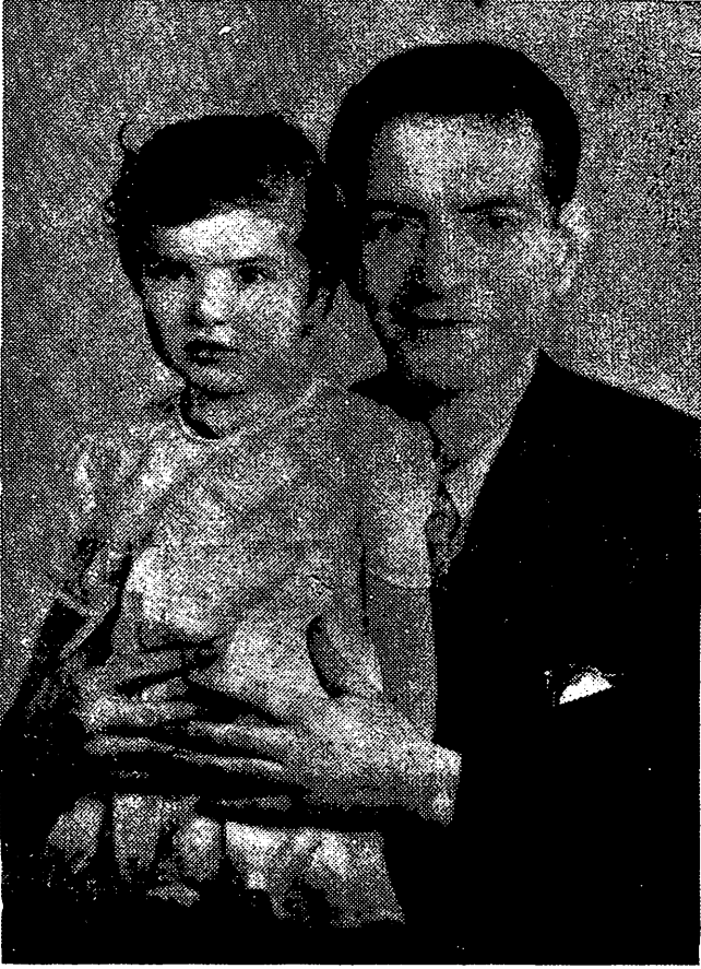
شهریار و شهرزاد